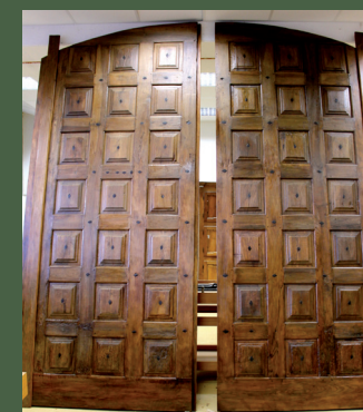
A fianco, portale Palazzo Gromo Losa restaurato all'interno del Cantiere Scuola di Restauro di Manufatti Lignei Antichi per Fondazione CRB

UNI EN ISO 9001:2008 per la formazione professionale ed i servizi orientativi. Accreditamento Regione Piemonte per la formazione professionale (certificato n. 520/001) del 17/06/03 e per l'orientamento professionale (certificato n. 527/001 del 14/09/04)