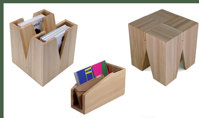
In basso, sgabello Multiplo design Marco Mazzà, Corso di Falegnameria e Design